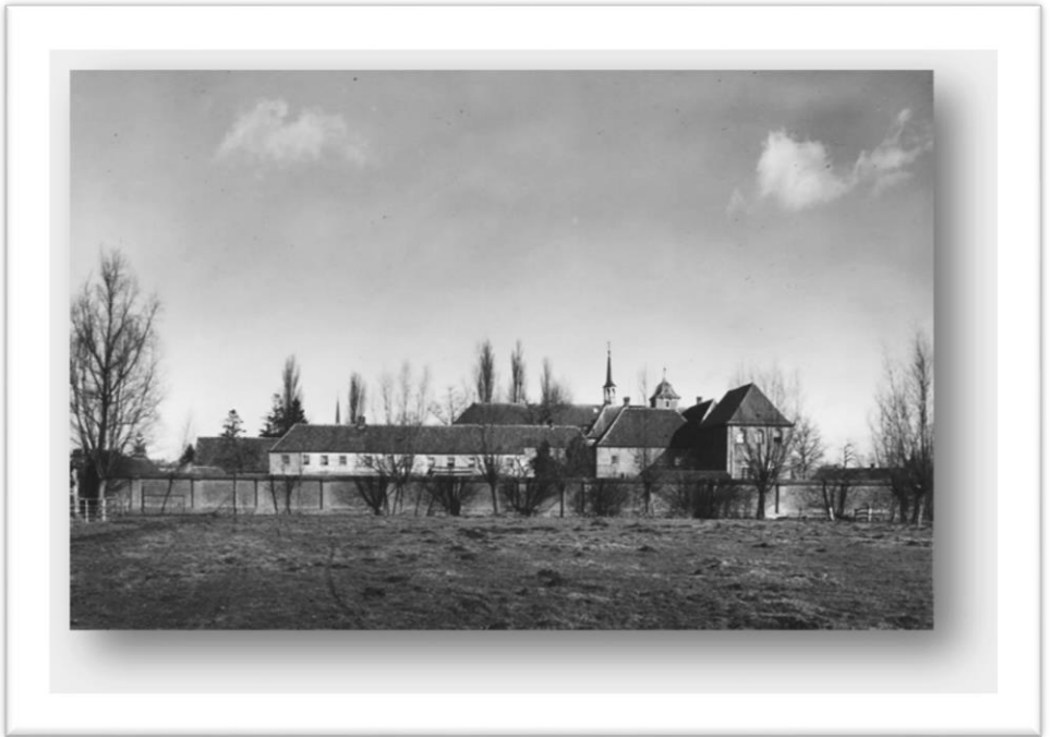
achterzijde van het klooster