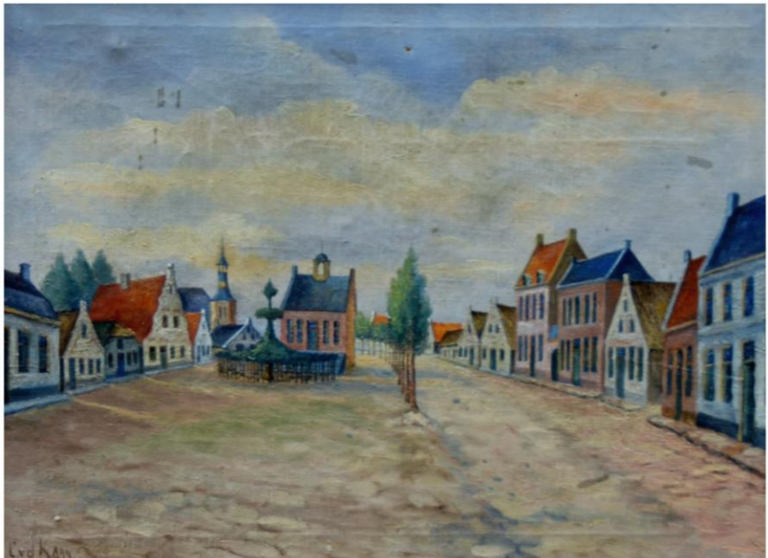
Markt met raadhuis - anno 1830

24 oktober 2018 www.mooirooi.nl/reader/280989#p=10