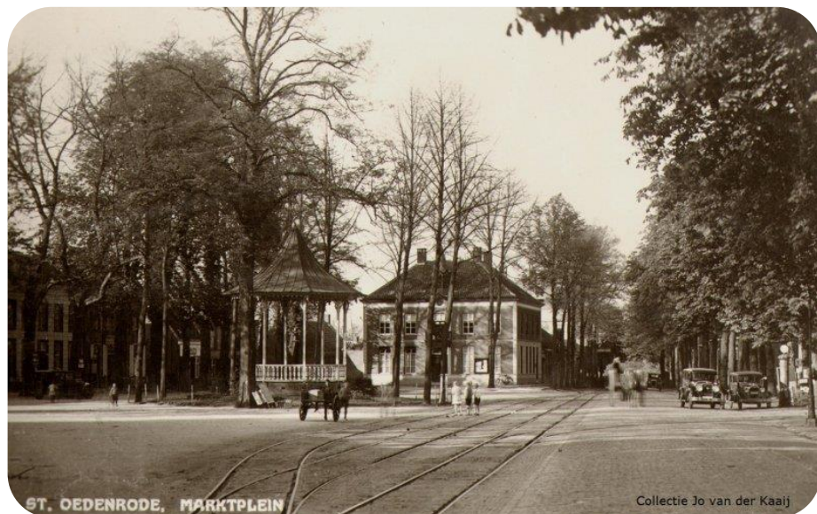
Raadhuis aan de Markt 1883-1963

21 november 2018 www.mooirooi.nl/reader/280993#p=22