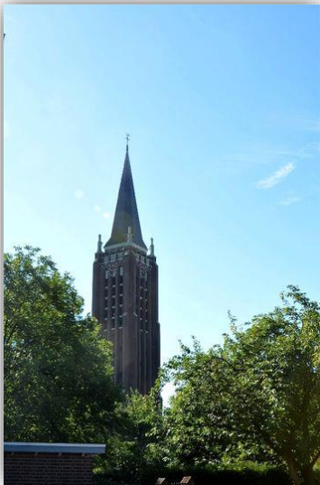
Grote Kerk

* U bezoekt een van de mooiste kerken van Nederland: de St. Petrus' Banden Kerk ofwel Grote Kerk. Dankzij z'n zeer imposante gestalte en indrukwekkende kunstschaten, wordt deze kerk ook wel 'De Parel van de Peel' genoemd.