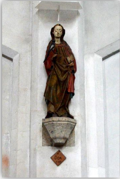
beeltenis H. Oda

* U beklimt de toren van de St. Petrus' Banden Kerk. Op weg naar boven bezoekt u verschillende presentatieruimtes waar u meer leert over de toren en zijn geschiedenis. Boven aangekomen komt u ogen te kort: hier hangt het prachtige carillon met liefst vijftig klokken én u heeft een fantastisch uitzicht over het centrum van Venray en (bij helder weer) over tientallen kilometers in de omgeving.