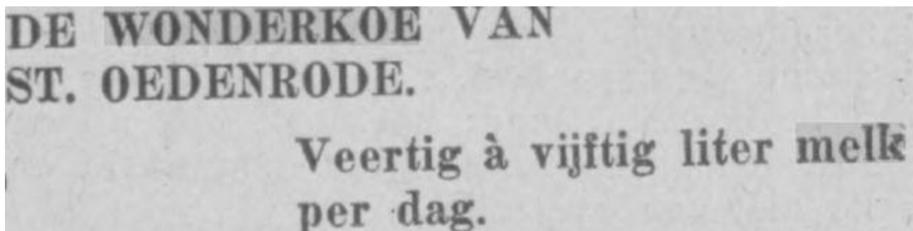
Krantenkop in het Leeuwarder Nieuwsblad van 08-08-1936. In de voorganger van Midden Brabant, de Rooise 'Handelsvriend' stond niks

In 1936 is het verhaal van de Rooise 'wonderkoe' groot nieuws in Nederland. Veel kranten, van het Leeuwarder Nieuwsblad in het noorden tot de Limburger Koerier in het zuiden, schrijven hierover. Enigszins gniffelend doen zij verslag over een koe die op een gegeven moment zelfs meer dan 50 liter melk per dag gaf: een gigantische hoeveelheid, en dat ook nog eens meer dan een jaar lang. Sommige kranten namen – zoals ook nu nog vrij gebruikelijk is – bij hun berichtgeving letterlijk elkaars artikelen over. Andere schreven vanuit een eigen perspectief en af en toe sprak men elkaar op essentiële punten ook tegen. Helaas zweeg het plaatselijke blad, het blad dat het dichtst bij de bron zat 'de Handelsvriend' – de voorganger van het latere Rooise blad 'Midden Brabant' – in alle talen, zelfs in het Roois. Misschien komt dat omdat het toen nog vrijwel puur een advertentie en mededelingenblad was – met o.a. gemeenteberichten – en er zelden een, door of namens de redactie, zelf geschreven artikel in stond. Maar misschien lag de zaak in Rooi voor een advertentieblad dat voor een groot deel afhankelijk was van de agrariërs te gevoelig en wilde het de vingers daarom hier niet aan branden.