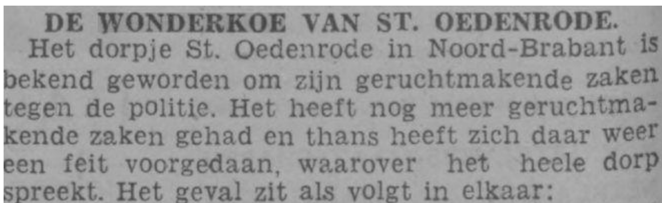
Ook de Limburger Koerier: Provinciaal dagblad schreef op 05-08-1936 over de Rooise wonderkoe. Rooi kwam in die tijd blijkbaar wel meer in het nieuws