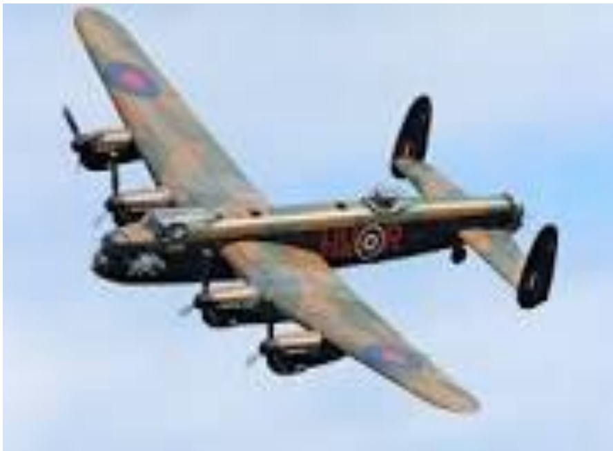
De boosdoener: een Britse lange afstandsbommenwerper, een Lancaster