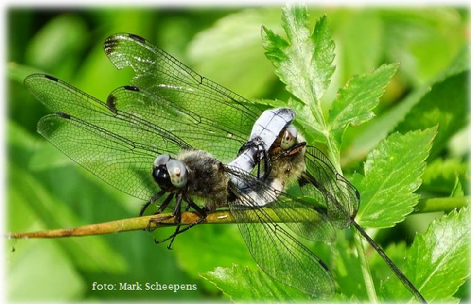
paartje 'bruine korenbout'

Welke soorten libellen doen het goed en welke hebben het moeilijk en waarom? Aan de hand van resultaten van eigen onderzoek, wordt u meegenomen in de wereld van de libellen.