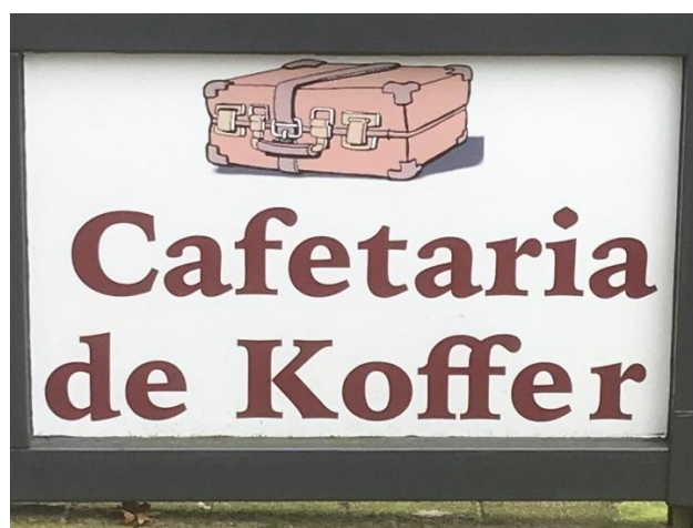
Reclamebord van Cafetaria 'de Koffer' in het Kofferen

Hoewel voor de hand liggend heeft de naam 'Kofferen' niet direct iets te maken met een hedendaagse koffer, hoe spijtig dit voor snackbar 'De Koffer' ook kan zijn. Koster Brock schreef in het begin van de 19 e eeuw in zijn boek 'Beschrijving der Vryheid St. Oden-Rode' dat het woord Kofferen al sinds 1550 bekend was als "een naam ontleend aan een kleine boerderije, voorheen daar aanwezig en gelegen tussen het goed der Strobolsche hoeve, de dreef van den Henkenshage en de gemeene straat." Pater Wiro Heesters vermoedt dat Kofferen en Koevering wel eens van hetzelfde woord 'koffer of koever' af kunnen stammen. Kofferen zou dan afgeleid zijn van 'kove' of 'kof' Dit betekent 'hutje'. Hieruit is dan later het woord 'koffer' voortgekomen in de betekenis 'draagkorf'. De 'en' van Kofferen 'duidt niet op meervoud maar komt van 'ing' en maakt van koffer een verkleinwoordje: 'draagkorfje dus. Maar hier is geen eenstemmigheid over want de 'en' zou ook oorspronkelijk 'heem' ((t)huis) kunnen zijn geweest. Hoe het ook precies zit, snackbar De Koffer doet er niet zo moeilijk over en geeft een voor de hand liggende maar wel geheel eigen interpretatie van de naam: een hutkoffer! Hoewel historisch pertinent onjuist smaakt de friet er niet minder om en bij het horen van deze naam weet eenieder meteen waar dit etablissement gezocht moet worden.