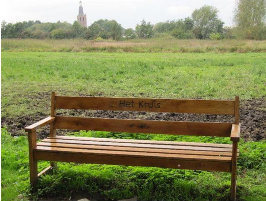
Bankgeheimen: 'Het Kruis' in het Everse

De voormalige 'Hoeve Kruiseik' heeft niets, net zoals het kruis in een broek, van doen met een kruisbeeld. In het verleden zijn alleenstaande eiken vaak gebruikt als grenspalen. Dit is veiliger dan houten of stenen grenspalen want die kunnen ongemerkt en zonder veel moeite verplaatst worden. Aan zo'n 'grenseik' ook wel 'kruiseik' geheten, bij een kruispunt van wegen, heeft deze boerderij waarschijnlijk haar naam te danken. Hoeve Kruiseik, gebouwd in 1930, is verdwenen. Zij is gesloopt in 2002 om te wijken voor de aanleg van de A50.