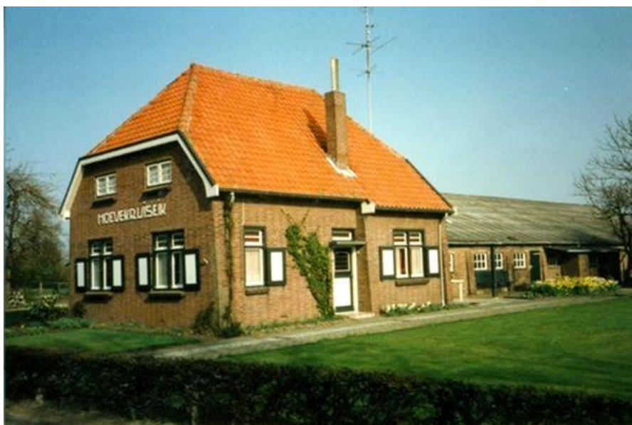
Hoeve Kruiseik: geen kruis

De voormalige 'Hoeve Kruiseik' heeft niets, net zoals het kruis in een broek, van doen met een kruisbeeld. In het verleden zijn alleenstaande eiken vaak gebruikt als grenspalen. Dit is veiliger dan houten of stenen grenspalen want die kunnen ongemerkt en zonder veel moeite verplaatst worden. Aan zo'n 'grenseik' ook wel 'kruiseik' geheten, bij een kruispunt van wegen, heeft deze boerderij waarschijnlijk haar naam te danken. Hoeve Kruiseik, gebouwd in 1930, is verdwenen. Zij is gesloopt in 2002 om te wijken voor de aanleg van de A50.