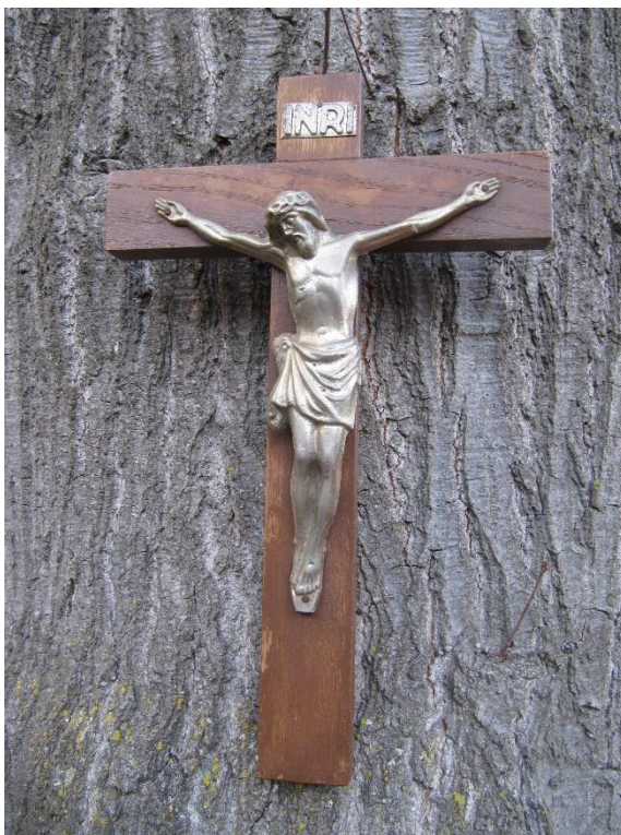
Een praatje en een biertje onder het kruis