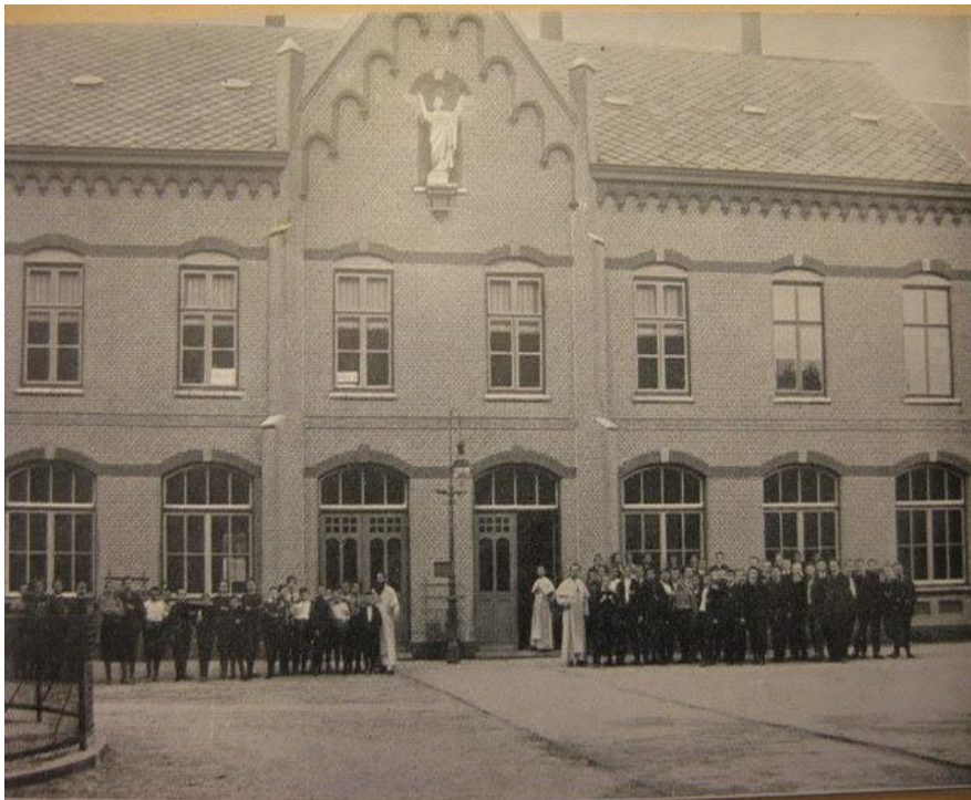
Het seminarie en missieschool in Grave