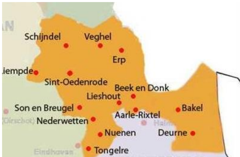
Het middeleeuwse graafschap Rode