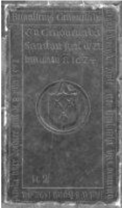
Grafsteen van de moeder en twee zussen van Gijsberus Coeverinx in de Sint-Jan, in het midden het familiewapen

BEGRAFFENIS GENOVEVA VAN BROGEL, WEDUWE WIJLEN PETER GIJSBRECHTS VAN COUVERING, STERF DEN 8 SEPTEMBER 1592; ENDE PETERKEN, HAER DOCHTER, STERF DEN 8 JULY 1572; ENDE GENOVEVA VAN SANTFORT, STERF DEN 21 JANUARY ANNO 1624.