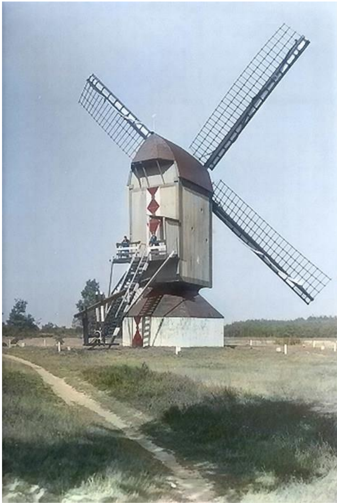
Hertog Jan / Koevingse molen van Everswijk; verwoest in 1944