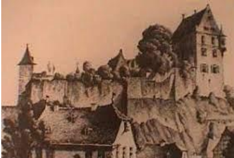
De grafelijke burcht in Katzenelnbogen