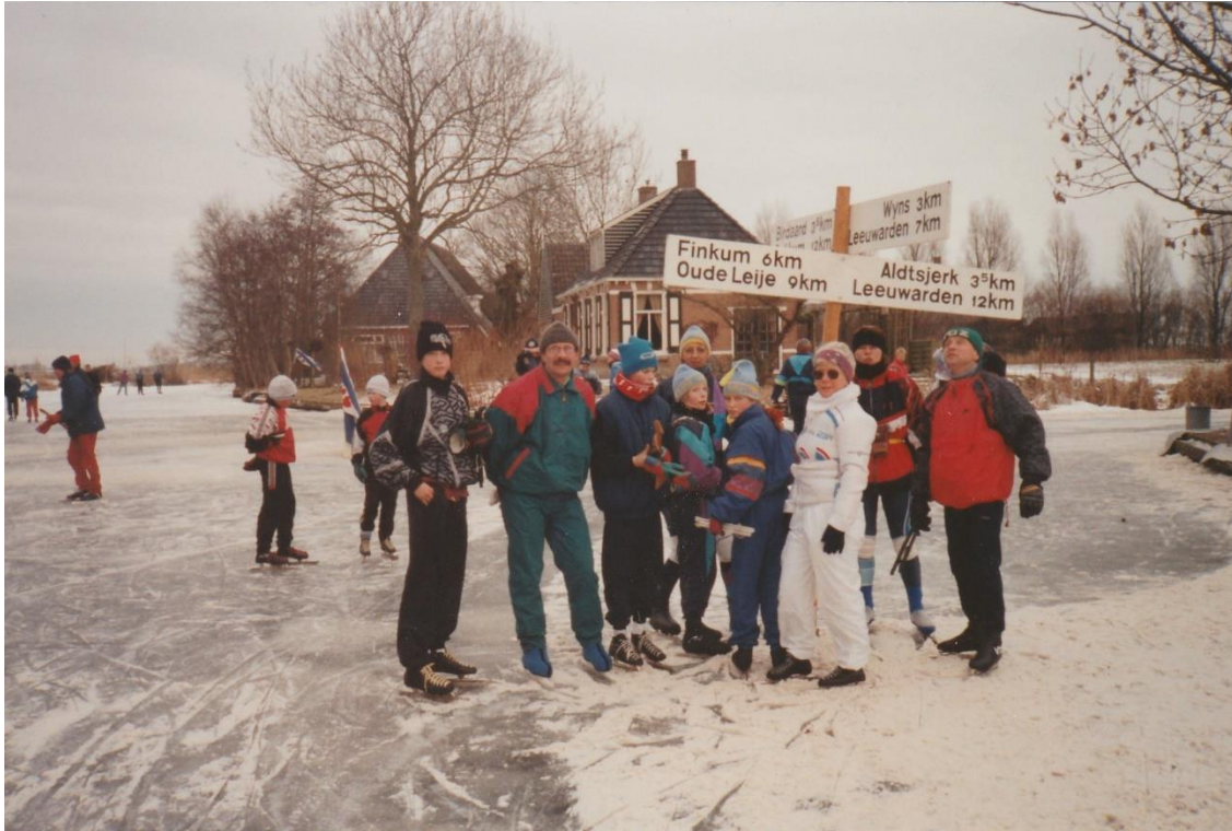
Leden van de 'Rooise IJsclub' onderweg tijdens een schaatstoertocht in Friesland