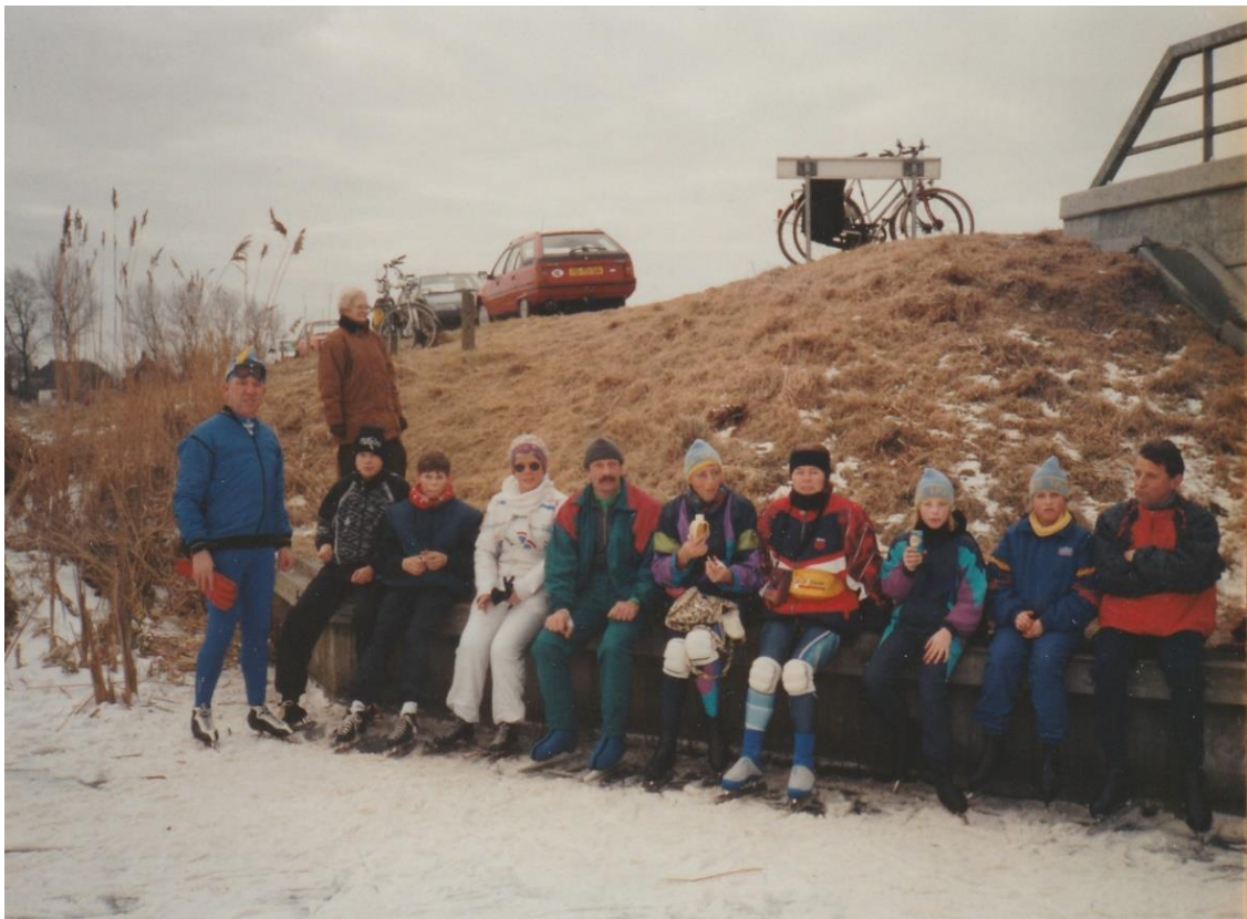
En natuurlijk even rust nemen voor de 'koek en zopie' onderweg: op het ijs bij de Moerkuilen